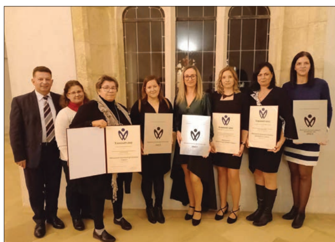
A Magyar Kultúra Napja országos ünnepségét Pannonhalmán tartották a Bazilika újjáépítése 800 éves évfordulóján, ahol miniszeri elismerések ünnepélyes átadására került sor:

Alsóörs Község Önkormányzata, az Eötvös Károly Művelődési Ház „Minősített Községi Szintér Címben” részesült, amelyet Veszprém Vármegyében három intézmény nyert el.