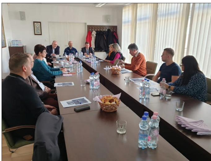
Alsóörsön ülésezett a Kistérségi Kábítószerügyi Egyeztető Fórum, mely fontos feladatot lát el a megelőzés terén.

Alsóörs Község Önkormányzata, az Eötvös Károly Művelődési Ház „Minősített Községi Szintér Címben” részesült, amelyet Veszprém Vármegyében három intézmény nyert el.