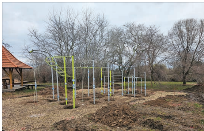
Így készült a Leader pályázati forrásból a szabadtéri kondipark a Mersében