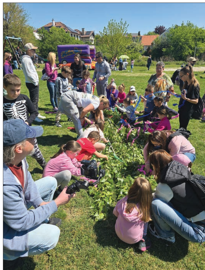
Családjaink felállították a község májusfáját – remek közösségi program keretében