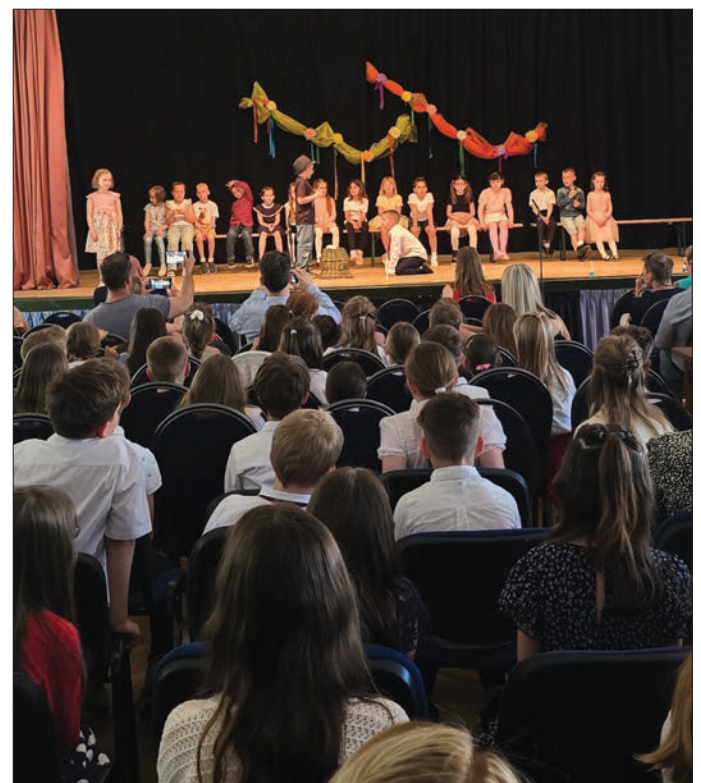
A Szülők Napja alkalmából iskolásaink köszöntötték szüleiket