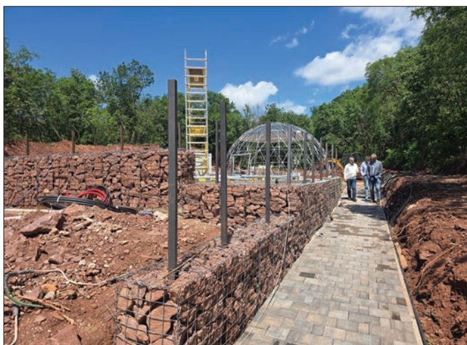
Jó útemben halad az AMFI továbbfejlesztése