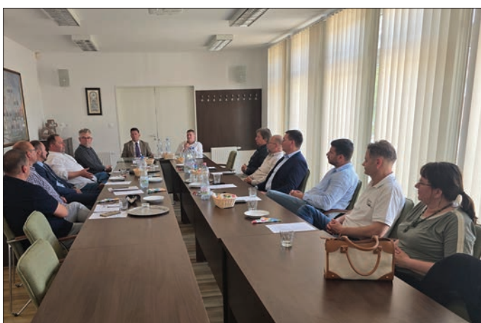
Alsóörsön ülészetek a térség polgármesterei