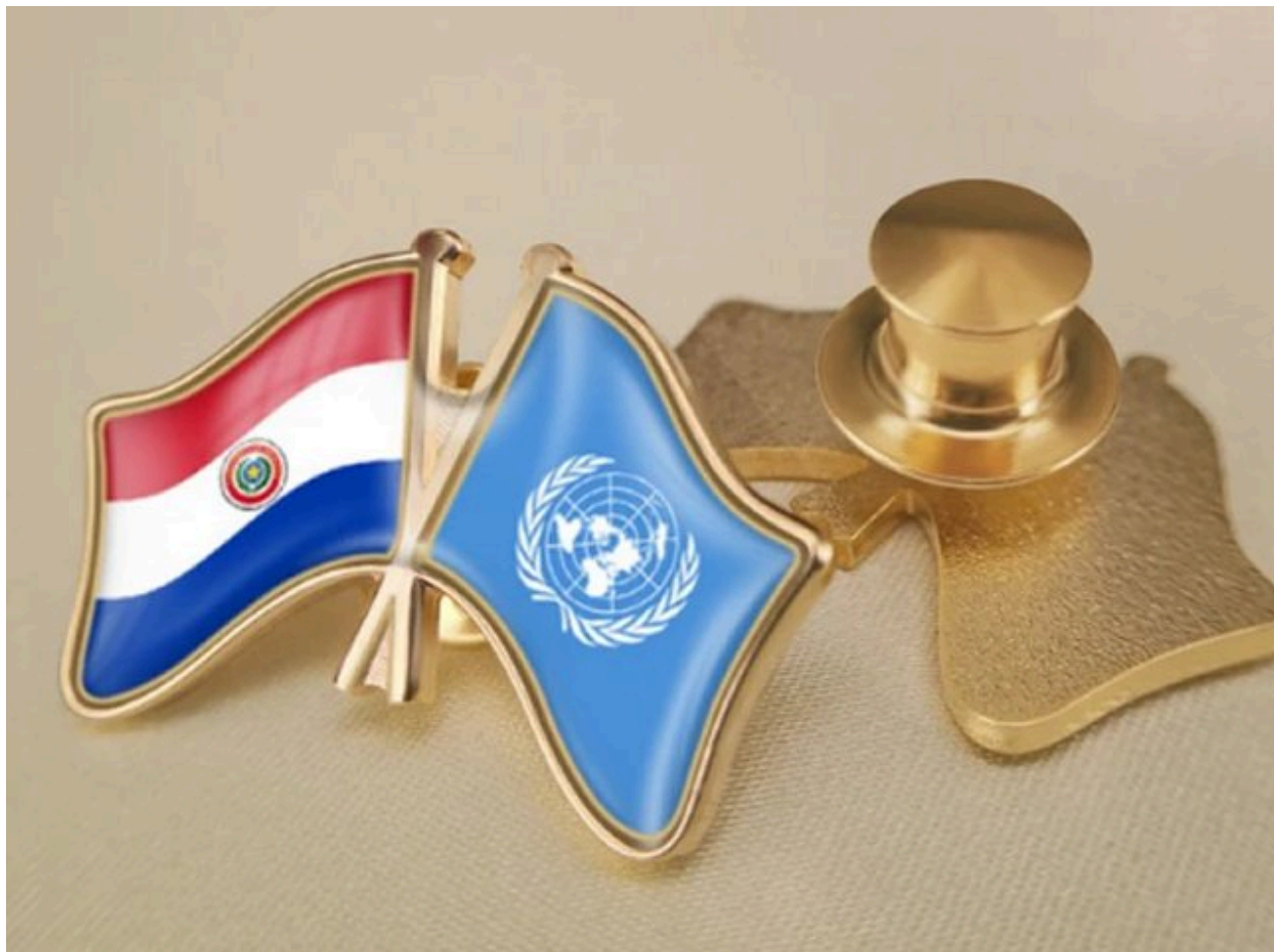
1958 óta július 30. A BARÁTSÁG NEMZETKÖZI NAPJA. Paraguayban hívták életre.