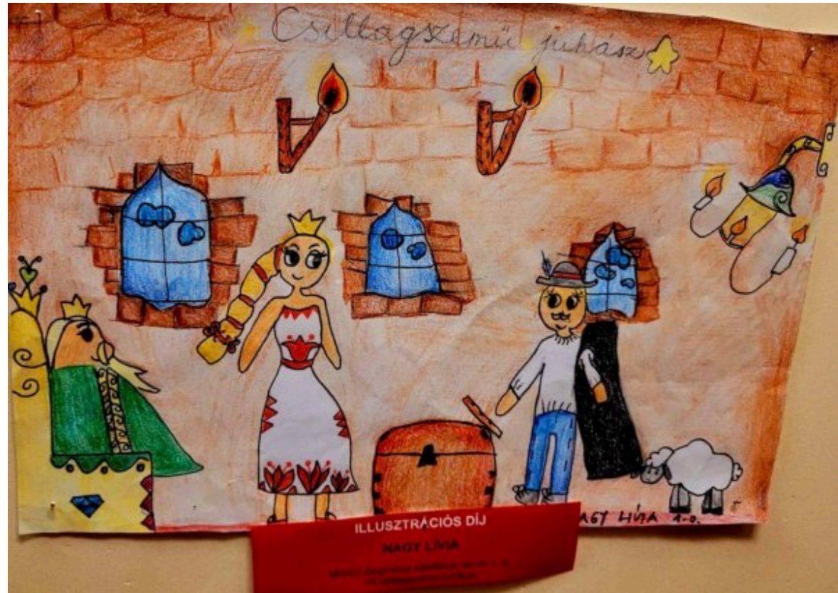
Nagy Livia (Dunaújváros) 7 éves rajza